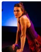
L'AMOUR SOUS ALGORITHME