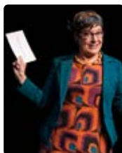
#BALANCE TON OLYMPE