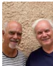
ALLÔ LA MER