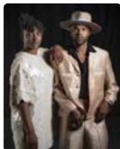
DYNA, LEWIS & THE SOUL CARAVAN