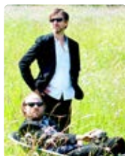
LE PRINCE DE DANEMARK