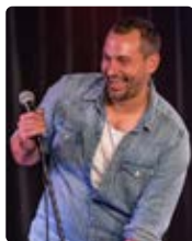
PE - Ça ne s'est pas passé comme prévu