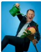
Y'A D'LA JOIE