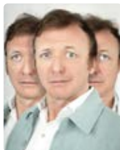
L'EMBARRAS DU CHOIX