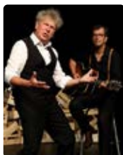
SIAMO SOLO NOI