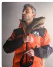
FILS DE BÂTARD