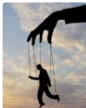
D'OMBRES ET DE LUMIÈRES