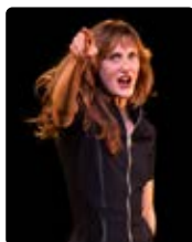
PÉPÉE, UNE HISTOIRE SANS CHUTE