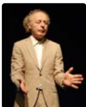
EN TOUTE INQUIÉTUDE