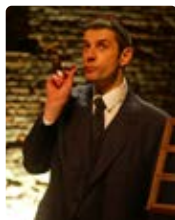
ÉLOGE DE L'OISIVETÉ